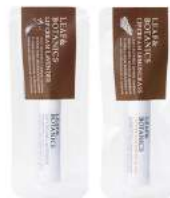
リップクリーム 4g 各¥700