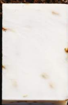
マザーソープ ラベンダー 90g ¥400 【粹練り製法】