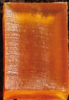
マザーソープ グレープフルーツ 90g ¥400 【透明粹練り製法】