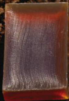
マザーソープ ゼラニウム 90g ¥400 【透明粹練り製法】

釜焚き製法でつくった石けん素地に、エミリエント成分や吸着成分を配合。クリーミーな泡が潤いを取り過ぎず、すっきりと洗い上げます。素早い泡立ちが特長です。