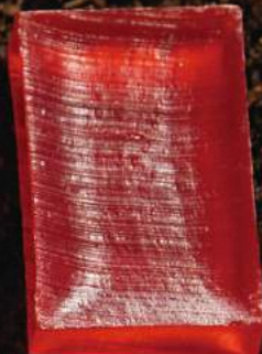
マザーソープ オレンジ 90g ¥400 【透明粹練り製法】