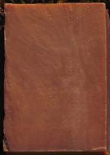
マザーソープ ローズマリー 90g ¥400 【機械練り製法】