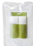
スキんケアトライアルセット オリーブ 約5日分 ¥700

オリーブ果実油やオリーブスクワランなどの4種類の植物由来エモリエント成分を配合した乳液です。角質層の水分と油分のバランスを整え、ハリとツヤを与えます。