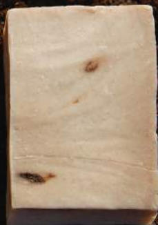
マザーソープ レモングラス 90g ¥400 【機械練り製法】